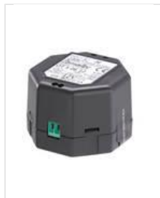
NT12-500 Netzteil, 12 V DC