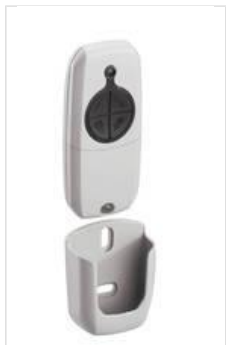
HS004-- F 4 Kanal