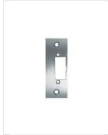
SB- SK U

Kurzes Flachschießblech, eckig ohne Riegelausschnitt.