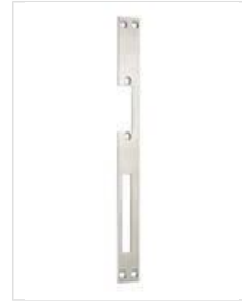
SB- HF U RSK

Eckig und mit Riegelausschnitt, sowie vorgerüstet für Riegelschaltkontakt.