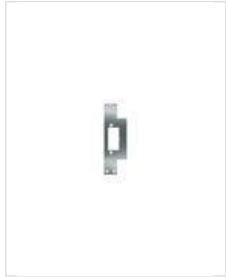
SB- NF 130

Kurzes Flachschießblech, eckig ohne Riegelausschnitt.