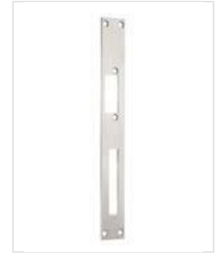
SB- HF U

Eckig und mit Riegelausschnitt, sowie vorgerüstet für Riegelschaltkontakt.