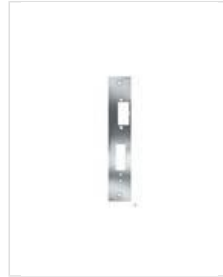
SB- SR U

Kurzes Flachschießblech, eckig ohne Riegelausschnitt.