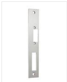
SB- SF U