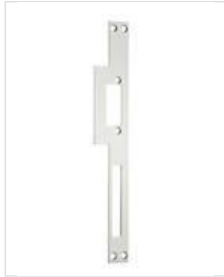
SB- NF1 U

Kurzes Flachschießblech, eckig ohne Riegelausschnitt.