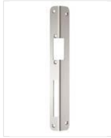
SB- WI L DIN links einsetzbar