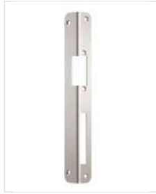
SB- WI R DIN rechts einsetzbar