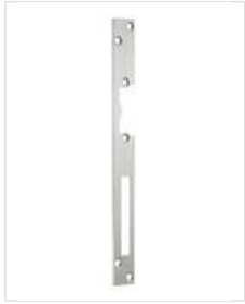
SB- HZ U Eckig und mit Riegelausschnitt.