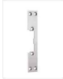
SB- KL 130 Kurzes Flachschließblech, eckig ohne Riegelausschnitt.