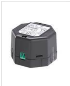
NT12-500 Netzteil, 12 V DC